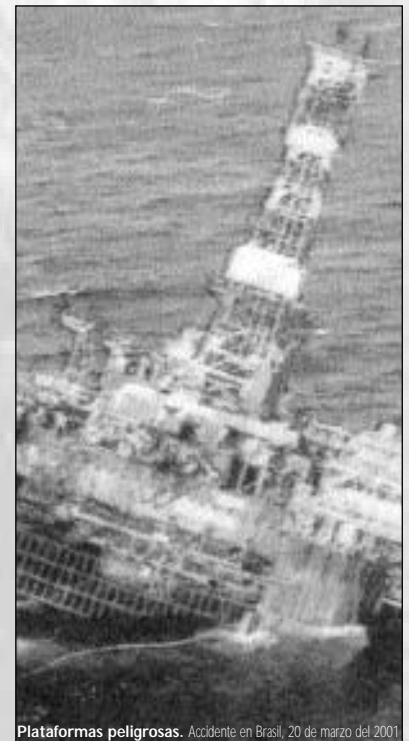
Plataformas peligrosas. Accidente en Brasil, 20 de marzo del 2001

En resumen, el historial ambiental, legal y político de estas empresas petroleras es bastante dudoso.